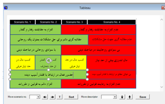
تصویر ۱۱. خروجی نرم افزار سناریو ویزارد و معرفی سناریوها

بعد از ثبت نظر خبرگان درخصوص میزان اثرگذاری مثبت و منفی حالات پیشرانها بر یکدیگر، نرم افزار سناریو ویزارد، سناریوها را در اختیار ما قرار می دهد. همانگونه که مشاهده می شود، نرم افزار یک سناریو آرمانی و یک بدترین سناریو ۱ (سناریو شماره دو و چهار) ارائه داده و دو سناریو در میانه را بیان کرده است. از این رو برای بررسی بهتر، نگاهی دقیق تری به سناریوها انداخته می شود.