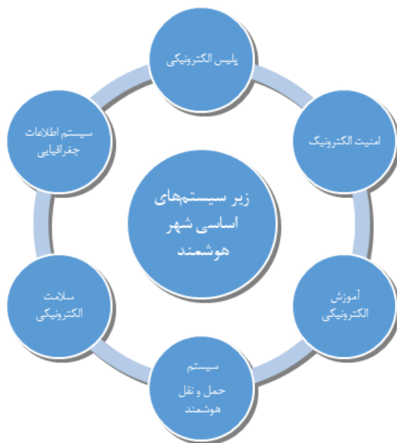
شکل ۲. مدل مفهومی زیرسیستم‌های شهر هوشمند

خدمات پلیس الکترونیک طراحی شده است. با این حال، پلیس الکترونیک شامل سایر خدمات اضطراری نیز همچون اورژانس، آتش‌نشانی و... می‌شود، چراکه از یک فرمان واحد، یا مرکز موقعیتی (مرکز کنترل مأموریت)، استفاده می‌کند. شکل (۲)، مدل مفهومی زیرسیستم‌های شهر هوشمند را نمایش داده است.